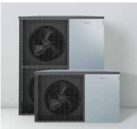
Nové venkovní jednotky v designu Viessmann – Made in Germany.